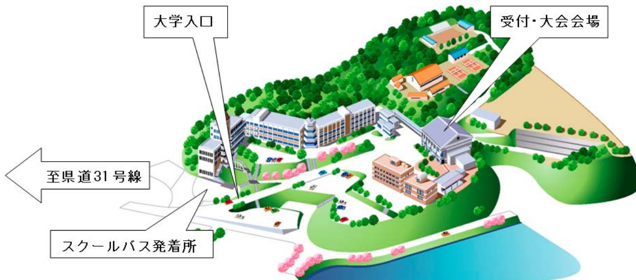
<西九州大学キャンパスマップ>